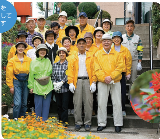
旭町二丁目町内会・リフレッシュクラブの皆さん