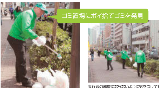
ゴミ置場にポイ捨てゴミを発見

主な活動内容/毎月第2・第4木曜日 朝10時から約1時間 歩道清掃 緑化活動(花植え等) 渋谷区にある本社ビルと、新宿区にある西新宿ビルの社員が日常利用する最寄の駅、バス停から自社までの周辺道路・歩道の清掃・ゴミ拾い、植込みの簡単な手入れを行っています。