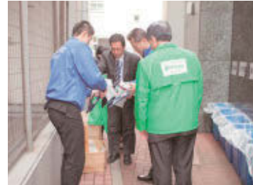
清掃前にゴミ袋や軍手、ゴミ拾いトングを配布!