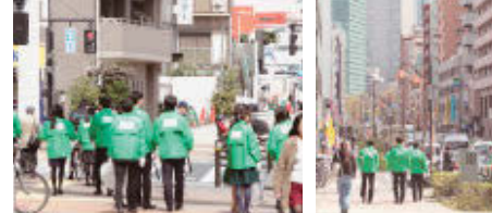
お掃除隊の出発。それぞれの担当エリアへ!

地域の皆様からの感謝の言葉が活動の励みに! 東京ふれあいロードプログラムへの参画で、環境に対する社員一人ひとりの意識が高まっています。