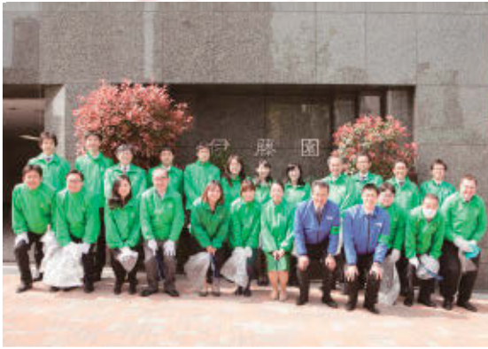
伊藤園本社ビルの前で。美化活動には毎回各部署から30人前後の社員が交代で参加しています。

環境に対する意識は年々高まり、道路空間にもうるおいと安らぎが求められています。私ども公社では、地域住民の皆様のボランティアによる快適な道路環境づくりを目指す東京都の「東京ふれあいロード・プログラム」に協力しています。