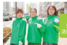
グリーンジャンパーが活動の目印です!

自分たちが働くまわりのきれいにしたい! 美化活動をする中で働く地域への思いが強くなっています。