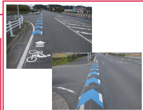
交差点内カラー塗装「溶融型路面カラー塗装」